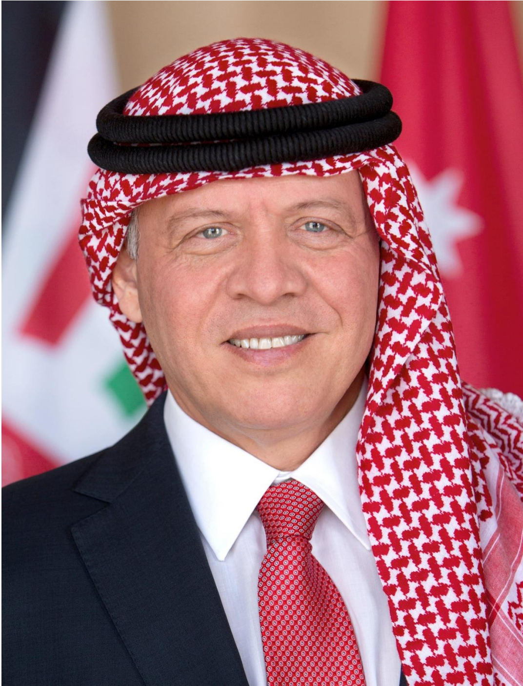
حضرة صاحب الجلالة الملك عبد الله الثاني ابن الحسين المعظم