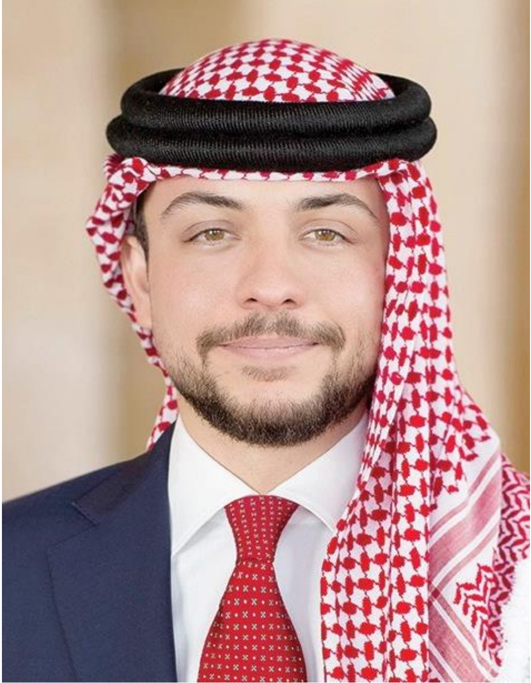
حضرة صاحب السمو الملكي الأمير الحسين بن عبد الله الثاني ولي العهد المعظم